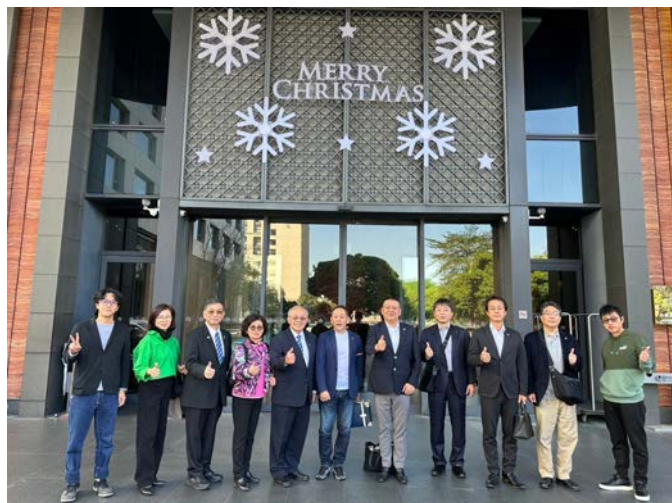
翌日台南出発前ホテル前