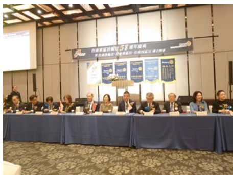
各クラブ会長(社長)