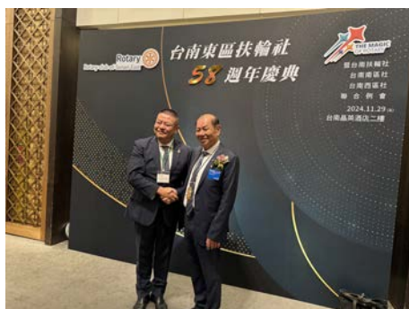
式典前台南東区会長と握手