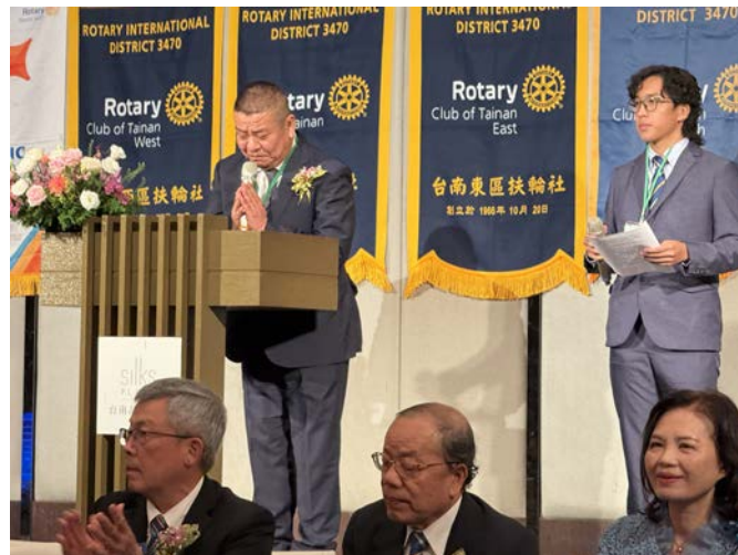
三荒会長挨拶—横は通訳の方