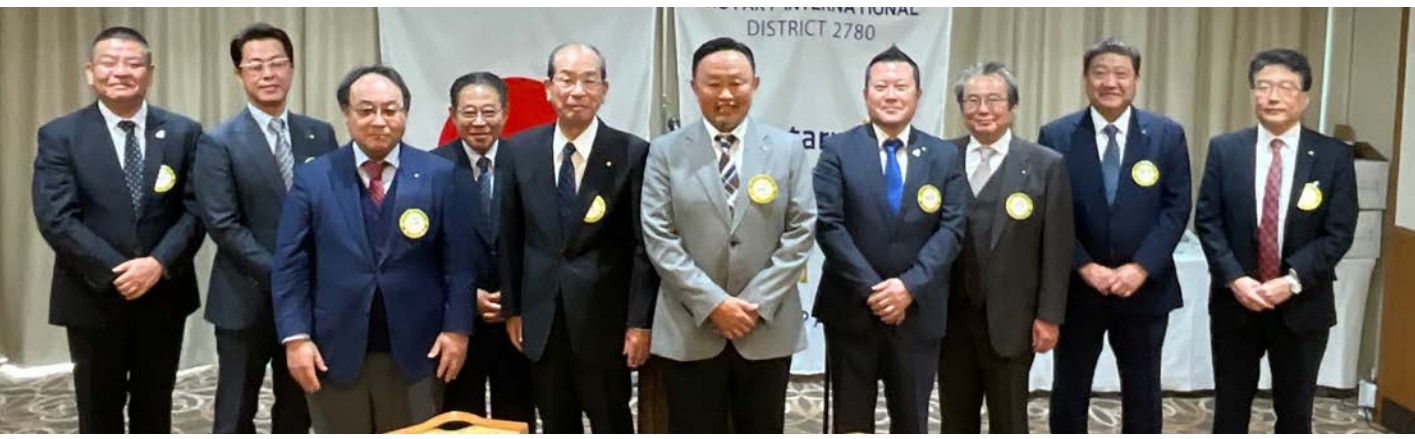
承認された2025-26年度の理事役員の皆様