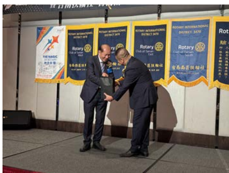
台南東区会長と記念品の交換