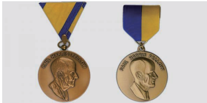
ポール・ハリス・フェローの初代メダル(左)とその後のメダル。長い年月の中で、このメダルとともにさまざまな襟ピンやリボンが使われてきました。

PHFレベル8 三荒会長 寄付額が $ 9,000 に達し、レッドストーンが3個のピンバッジが贈られます