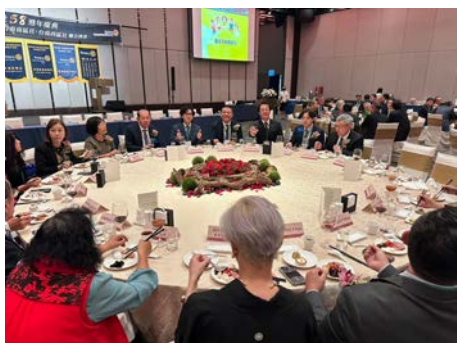
各クラブ会長のテーブル