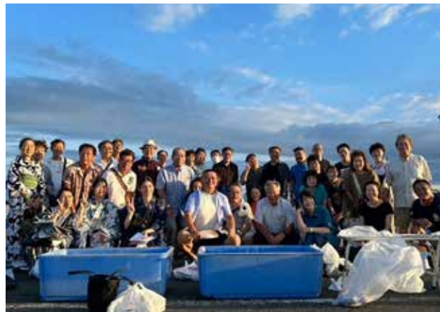
花火大会開始前に記念撮影

今例会は 38 名の皆さんにご参加頂きました。会員の皆さん、ご家族の皆さん、平塚北ロータリークラブの 6 名にもメイキャップいただき、本当にたくさんの皆さんにご参加頂いたおかげで、親睦委員会最初の事業を盛会に終わることができました。今回の花火大会を経験し、人と人が集い、懇親を深めてこそ「親睦」が深められるのだと感じました。お食事をしている時、花火観賞をしている時の皆さんの笑顔がとても嬉しかったです。今後も親睦委員会として世代間の交流を積極的に深め、「つながり」を生み出していけるよう尽力して参ります。ご参加・ご協力いただきました皆さんに感謝を申し上げ、開催報告とさせていただきます。