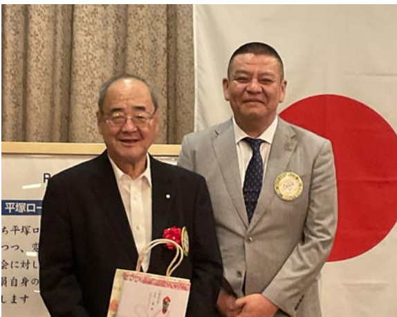
例会日がちょうどお誕生日の升水会員(左)いつもお元気で！