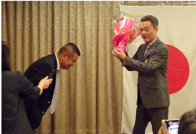
三荒会長エレクトから感謝の花束を受け取られた白石会長