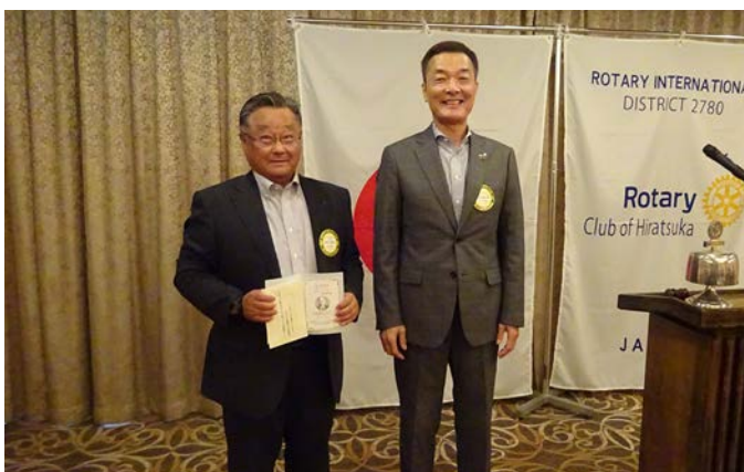
第6回米山功労者感謝状を受賞された会員