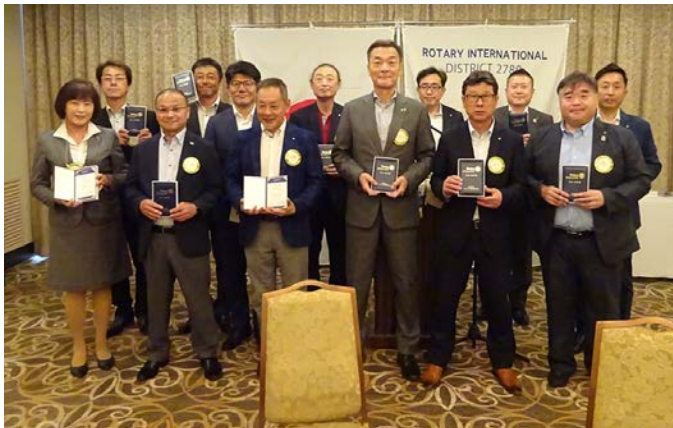
第1回米山功労者感謝状を受賞された会員

来週は23-24年度最終例会です。親睦委員会主催の23-24年度新会員歓迎夜間例会となります。例会場にて18時よりの開催となりますので、時間をお間違えの無いようお願いいたします。出欠のご連絡がまだの方はお食事の準備がありますので、必ず本日に事務局までお知らせください。