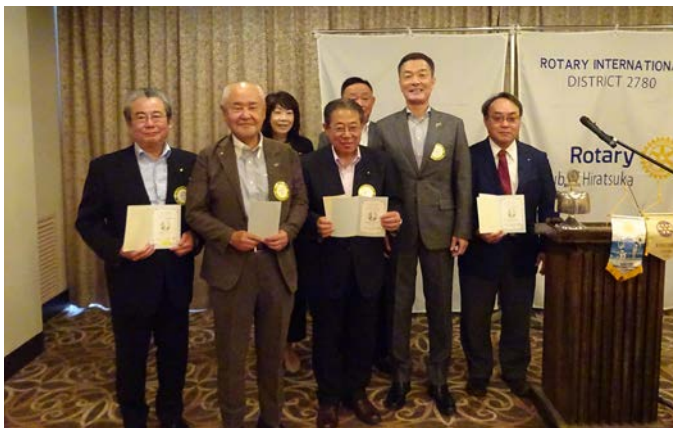
第2回米山功労者感謝状を受賞された会員