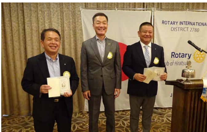
第3回米山功労者感謝状を受賞された会員