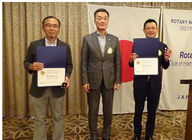
ポール・ハリス・フェローの認証状をうけとられた 又城会員(左)と松本会員(右)