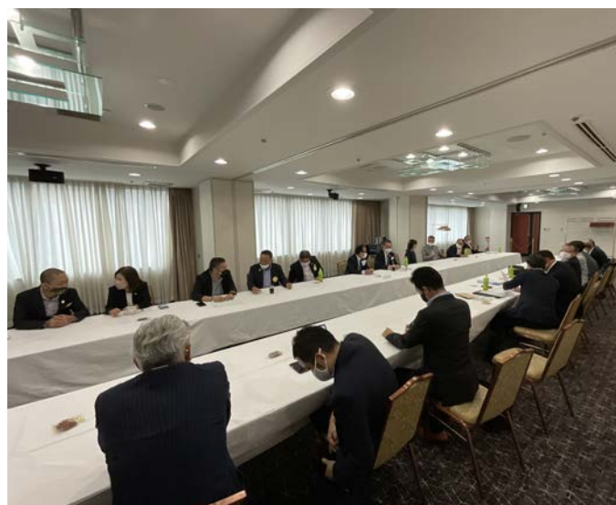
例会後にガバナーとお茶を飲みながら和気あいあいと会員との懇談会。ガバナーへの質問もありました