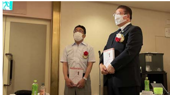
誕生日祝いの馬上会員とお誕生日と結婚記念の二重のお祝いの清水会長