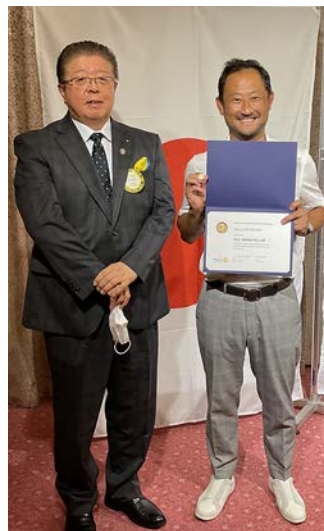
日坂会員へR財団より ポール・ハリス・フェローの 初めての認証状授与