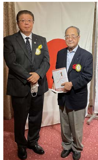
会長より升水会員へ 誕生日の祝いをお渡し