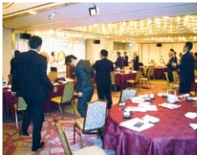
“マツケンサンバ”をご教授いただきました。

紅白歌合戦にも、コンサートにも健さんの相手役で躍らせて頂き、宝塚で勉強してきたことが役に立っているということですね！