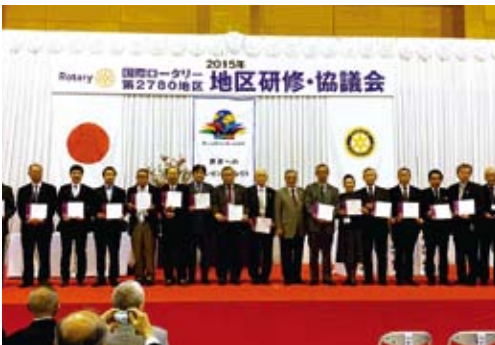
End Polio Now キャンペーン表彰式