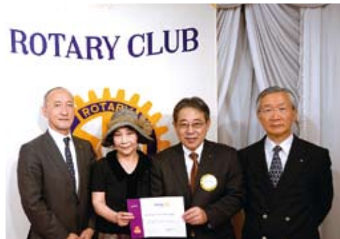
End Polio Now キャンペーン表彰をお祝いして