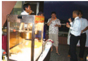
今回はポップコーンを作りました