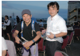
ビールサーバーマン