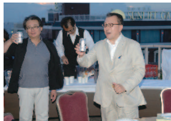
乾杯 常盤会長エレクト