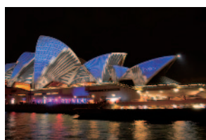
船からのシドニー・オペラハウスの夜景