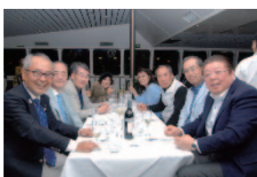
地区ナイト・ディナー～