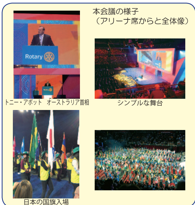
本会議の様子 (アリーナ席からと全体像)