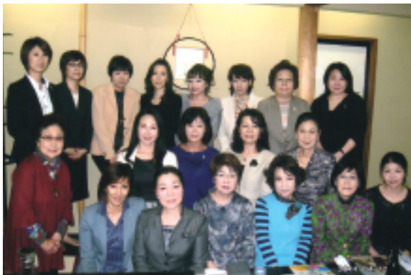
第8G女性ロータリアンと事務局会

ロータリーについての意見や希望、また女性会員としての会員増について意見交換しました。