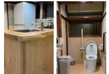
使い易くなった水回り (*2)