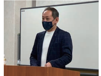
会員研修委員会の元吉委員長