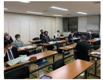
4月14日に開催された第2回新会員研修セミナーの様