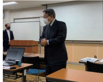
柏手会長よりロータリーについてご説明