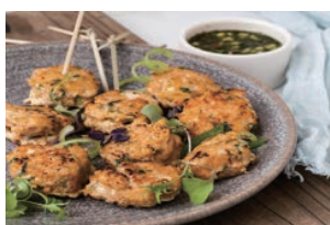
焼き魚のみじん切り