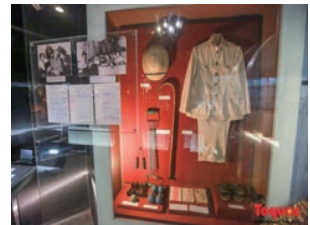
ホーチミン博物館に 展示する物

ホー・チ・ミン生誕100周年の1990年に建設され、ソビエト連邦が建設の援助をした。かつてのベトナム人指導者ホー・チ・ミン氏および外国の支配に抵抗するベトナムの革命闘争に捧げられた博物館である。