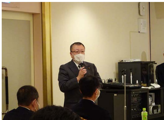
地区米山奨学会・学友会常盤委員長より 第一回米山学友会同窓会のご報告がありました