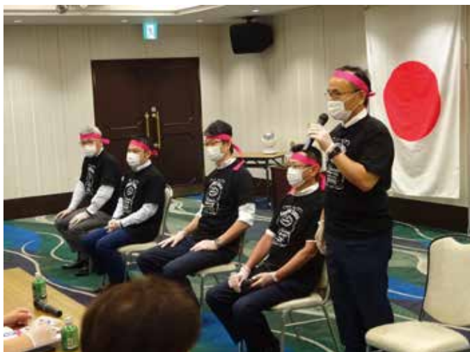
19-20年度入会された5人の方々