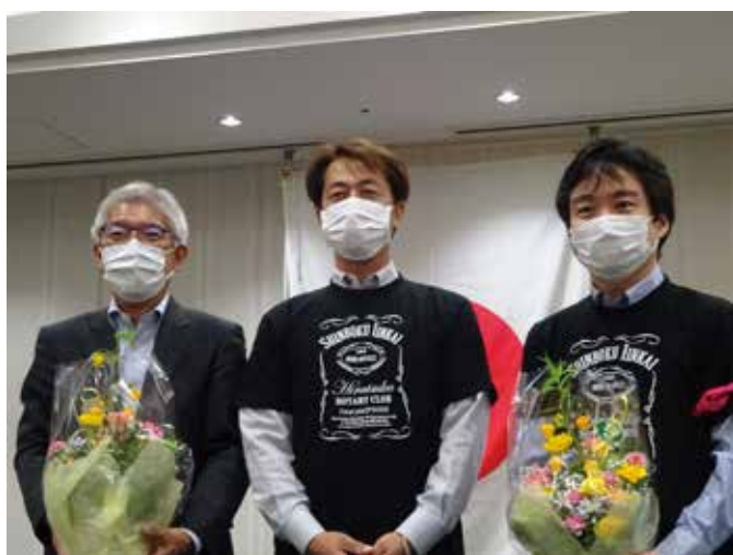
米山委員長より花束を受け取られた6月末で退会される武澤会員と上野会員