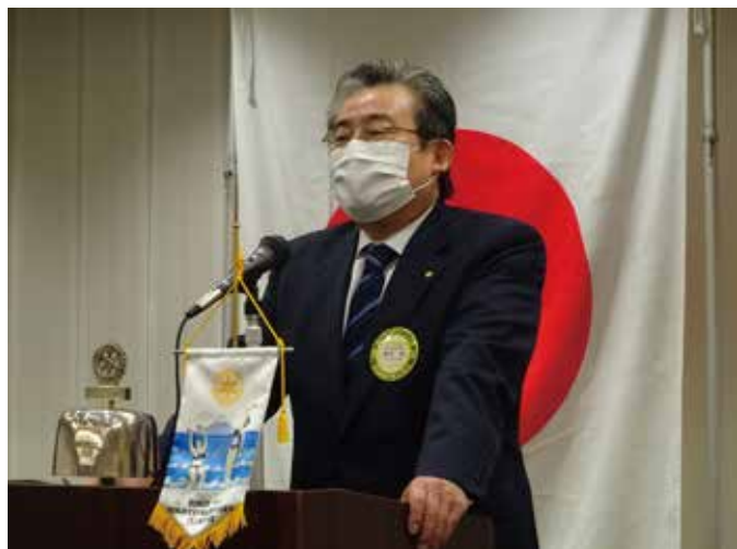
19-20清水裕年度の最終例会のご挨拶