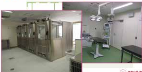
神奈川県 動物愛護センター