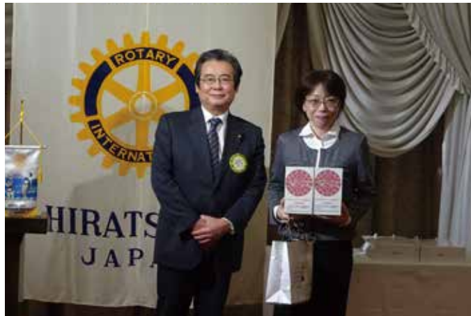
会員よりの動物愛護センターへの募金を受け取られた土肥所長