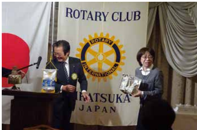
会員からの寄付を受け取られる土肥所長