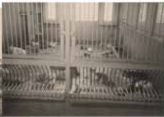
神奈川県 動物愛護センター