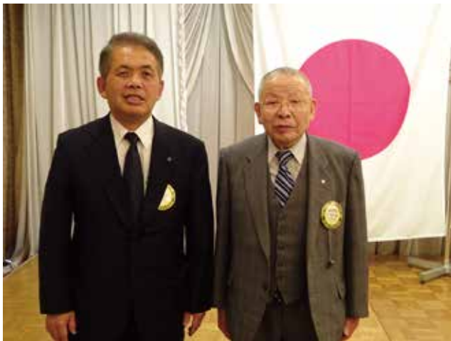
今年も会員健康診断をして下さった 小笠原会員と会長