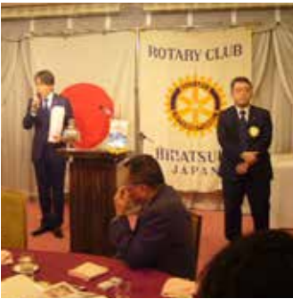
ご挨拶される勝田新会員