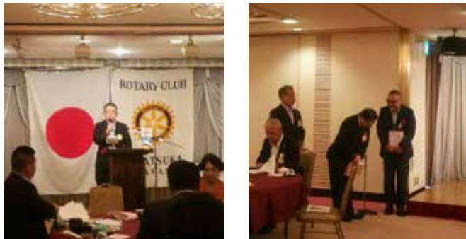
今月お誕生日の方へのプレゼント