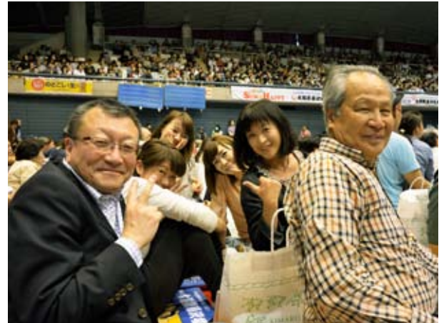
お土産は紙袋にお弁当・お茶・ビールにおつまみ、あと座布団も