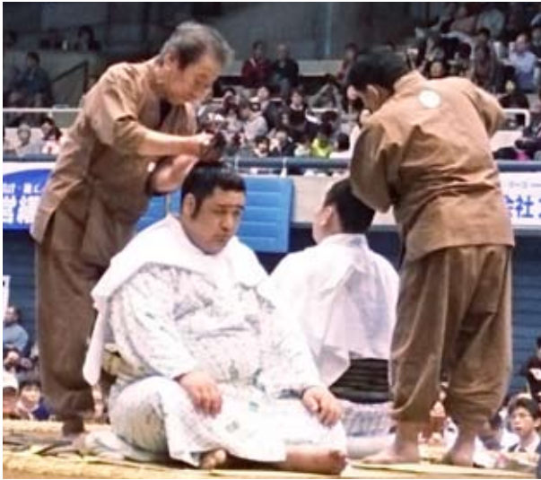
髪結実演…カメラの位置まで髻付け油の匂いがしました