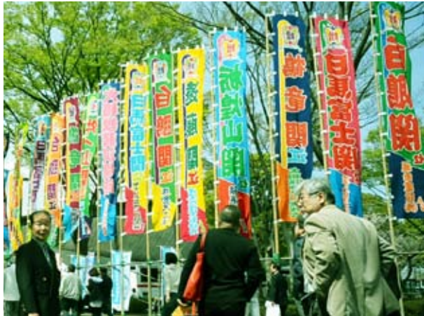
会場入り口…風にたなびいてキレイでした