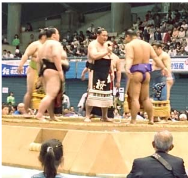
相撲甚句…持ち回りで甚句を歌います