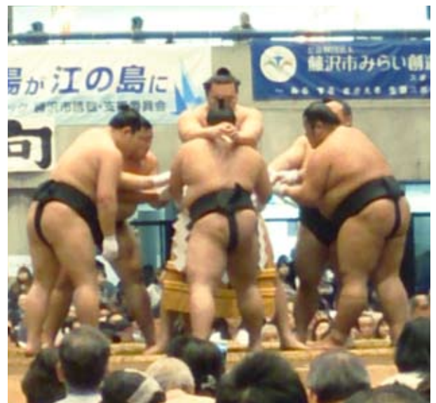
白鵬関の綱締め実演 (不知火型)