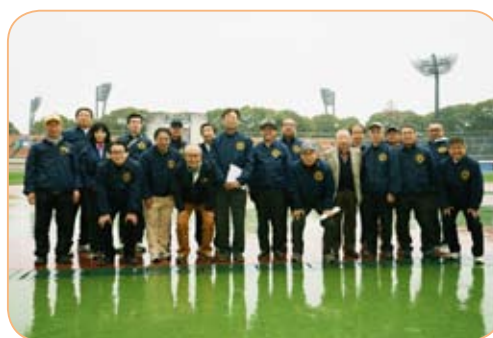
今年も無事終了しました