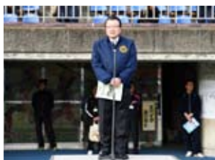
常盤会長開会挨拶