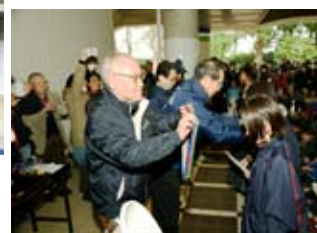
雨なのでゲート下で表彰式