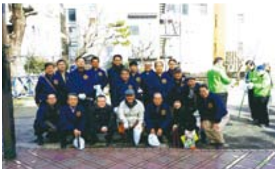
平塚RCから22名参加です

第8グループの7クラブ合同で2月21日(日) ROTARY DAY に合わせて、平塚駅周辺・中心街で清掃活動を行いました。当日は、朝から快晴の温かい日となり、7クラブで総勢81名が参加し、当クラブから22名が参加しました。