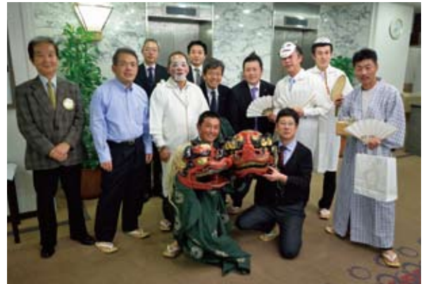
親睦委員会が獅子舞を披露、盛り上がりました！