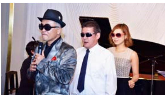
叶様親子と見事なダンス共演！