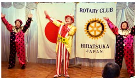
平塚駅北口でお馴染みの大門様ご一行