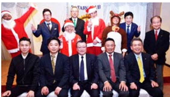
楽しんでいただけましたら幸いです (親睦一同)