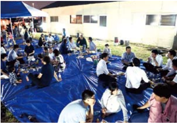
花火開始を待ちます