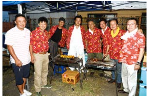
親睦委員会の皆様