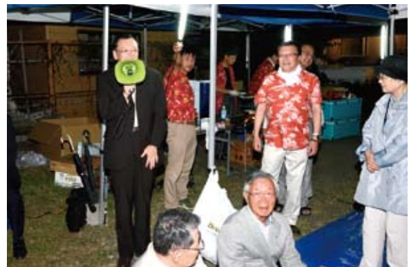
落合市長がご挨拶にお立ち寄り下さいました