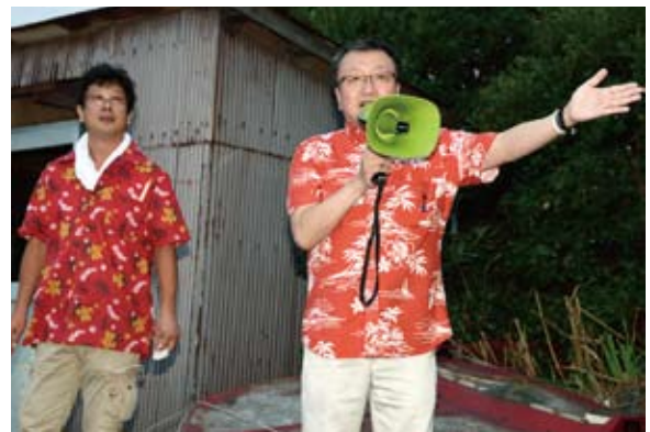
常盤会長と司会の葛西会員