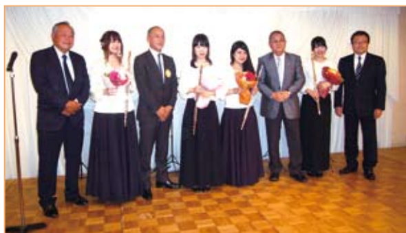
両会長・エレクトで花束贈呈