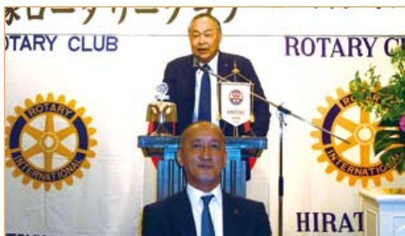
両会長開会のご挨拶

洗足学園音楽大学在学中、学内の選抜されたメンバーによる吹奏楽団「ホワイトタイ・ウィンドアンサンブル」のフルートパート4名で結成される。現在は学部を卒業し、様々な場所で演奏活動を行っている。フルートの美しい音色から新たな可能性を見つけ出し、楽しんでいただけるような演奏をお届け出来るよう【White Flute Quartet】として活動に励んでいます。