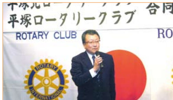
閉会の挨拶は常盤エレクト