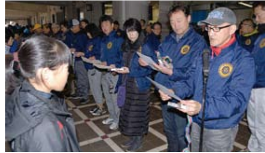
雨のため軒下で表彰式でした。