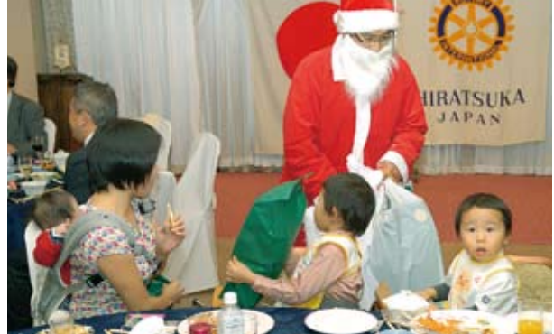
今年のプレゼントは何かな？