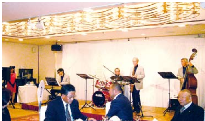
軽音楽愛好会の皆様です