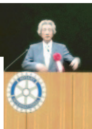
記念講演は小泉元首相