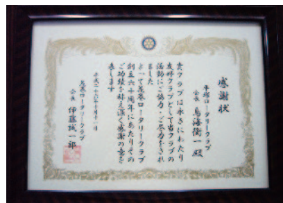
友好クラブとして感謝状をいただきました