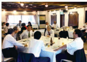
魚籃亭にて昼食 (横須賀海軍カレー)