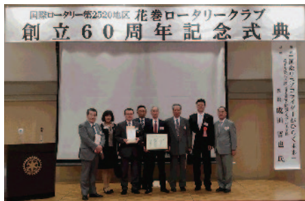
素敵な式典でした