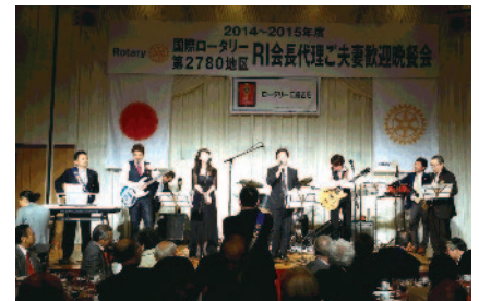
晩餐会では横須賀ロータリーバンドの演奏