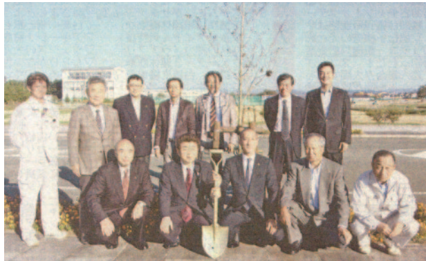
市総合体育館進入路にハナミズキを記念植樹した花巻、平塚両 RC 関係者ら

同体育館は 2 年後の岩手国体の会場として、全国から多くの選手、関係者が訪れる。市ではそれにふさわしい環境整備を進めているが、幾つもの会場を抱えているため、なかなか手が回らないのが現状で、花巻 RC の取り組みに感謝していた。