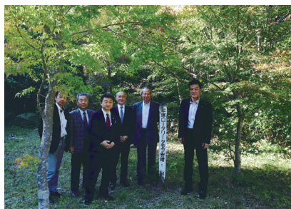
平塚 RC より 1998 年に寄贈した山モミジ