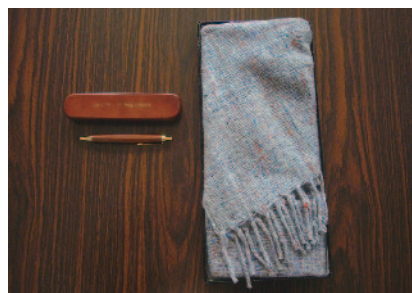
60 周年記念品も頂戴しました