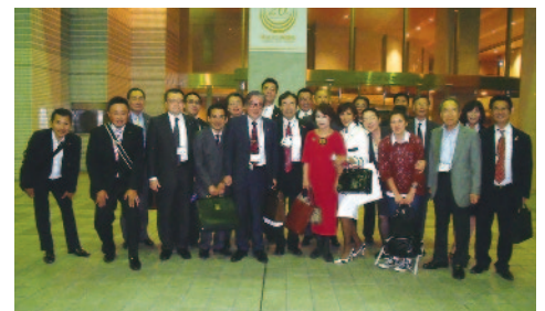
帰りの車中は平塚湘南RCの方も一緒に