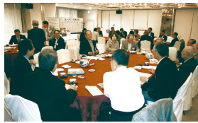
財団委員会とクラブ研修委員会

委員会を会長、幹事、副幹事、会計担当とIT委員会を除き、大きく3つに分け、(①奉仕プロジェクト委員会と会員委員会、②財団委員会とクラブ研修委員会、③クラブ管理運営委員会) これからの委員会の運営などについてお話しいただきました。