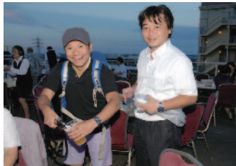
ビールサーバーマン