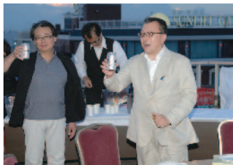
乾杯 常盤会長エレクト