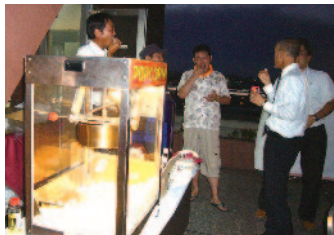
今回はポップコーンを作りました