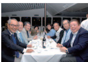
地区ナイト・ディナー～