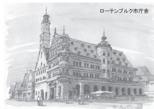
石造りの街ロクロナン

フランスを中心にいくつかの国をスケッチして歩いた。急行の止まる駅を降りたら当然タクシーがあると思ったのに、わずかの駅員しかいない小さな駅だった。困り果てていたら、若い駅員がすぐに携帯でタクシーを呼んでくれて助かった。言葉が通じず失敗したりすることもあったが、そのたびに優しい言葉をかけてくれる人がここにもいた。