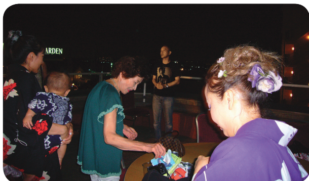
涼風吹く屋上席から、締めは鳥海エレクト

ましては(株)サン・ライフのスタッフの方々にご頼んでおりましたので、雨が降ったり、やんだり、再々のお手数をおかけ致しました。ご理解とご協力に本当にお礼申し上げます。スタッフの皆様、ありがとうございました。お陰様で7時の花火開始には屋上特上席にて、皆様お揃いで雨の上った南の夜空を見上げ大小の花火を楽しまれた事と思っております。思わず「タマヤー!!」