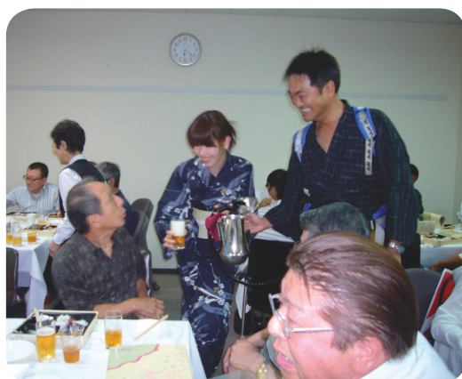
ビールが美味しいかは、お二人にかかっています！