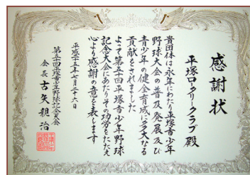
少年野球大会50周年記念の賞状

7/26から始まりました平塚市少年野球大会開会式に出席してきました。今回で50回とのことで記念の賞状をいただいて参りました。