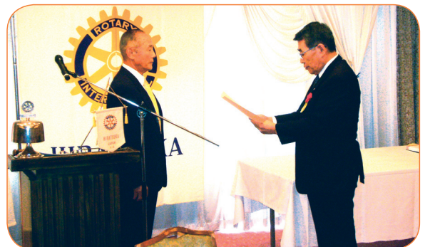
小飯塚前会長より賞状の贈呈