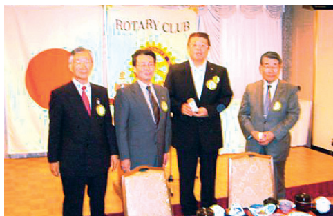
前・現年度会長幹事のバッジ交換