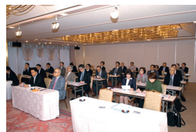
第3回新会員研修セミナー

まず入会を勧めていただいたスポンサーの方より100%出席をお願いしますと言われたこと。会員の方々のお名前をみて敷居が高く気後れしていた。入会後はロータリー用語がさっぱり理解できず時間がかかったこと。メーカーをして初めて他クラブの雰囲気、会員の違いなど大変勉強になったこと。スマイルボックスで