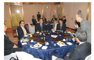
セミナー後の懇親会