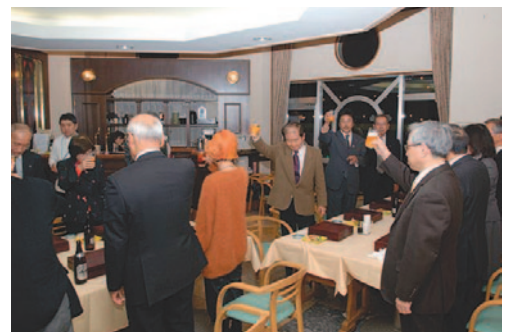
▲ セミナー後の懇親会