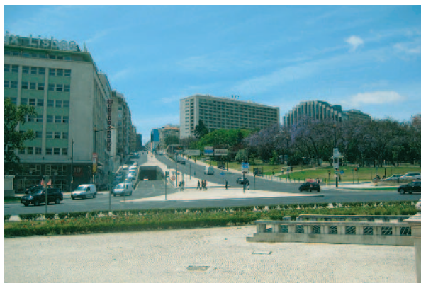
リスボンの中心であるボンバル侯爵広場で。右奥にジャカランダが咲いています。

Obrigado Lisbon and Rotarians from all over the world !!