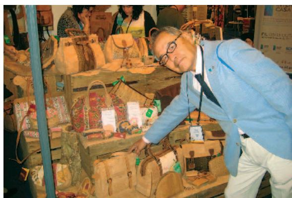
友愛の家にて。ポルトガルは世界一のコルク生産・輸出国だそうです。指さしているバッグもコルク製です。