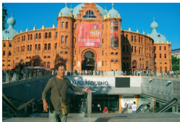
公式行事の一つである「ファド (Fado) の夕べ」が開かれた闘牛場外観です。“END POLIO NOW”の看板が掲げられています。