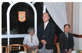
升水一義リーダーより 総評