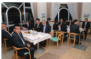
入会3年までの会員の方々