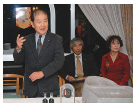
クラブ研修委員会