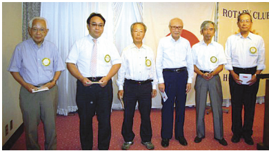
スマイル大賞受賞の皆様