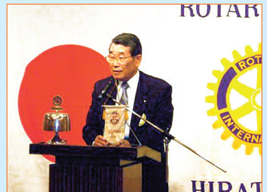
乾杯 小飯塚エクト