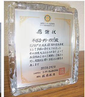
創立55周年記念寄付(米山)