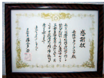
創立55周年記念寄付(みどり基金)

◎創立55周年記念として、寄付を贈りました平塚市みどり基金とロータリー米山記念奨学会より、それぞれ賞状とガラスの盾をいただきました。