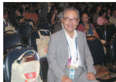
本会議場でのスナップ ともかく大きな会場でした。サッカーコートが10といったところでしょうか。左が参加記念で頂いたバッグです。