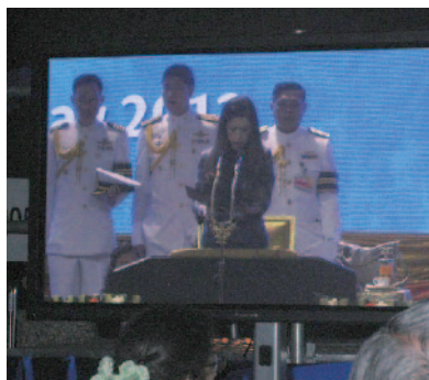
本会議@IMPACT Center タイ国第一王女のご挨拶