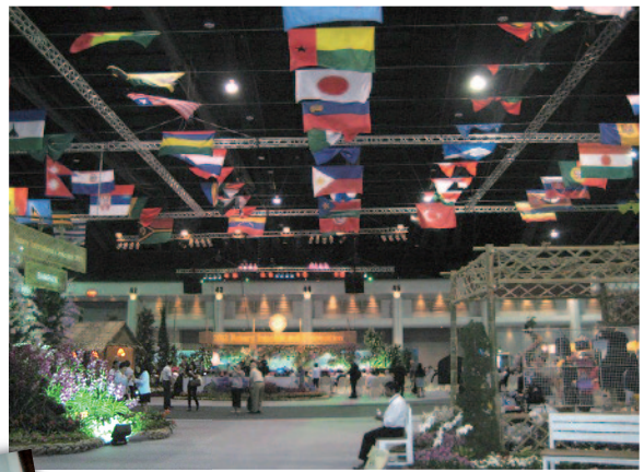
友愛の家フロアー@IMPACT Centre