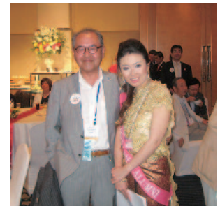
米山卒業生とのスナップ (コンパニオンさんでは ありません)