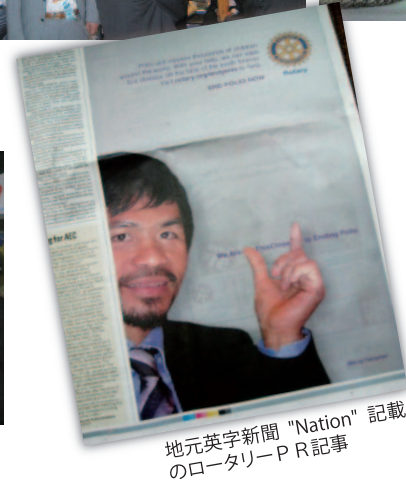
地元英字新聞 "Nation" 記載 のロータリーPR記事