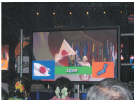
本会議 我が国旗が登場した瞬間