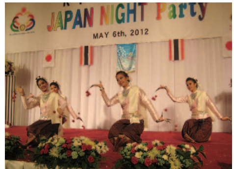
ジャパンナイトパーティー @Royal Orchid Sheraton でのタイ民族舞踊