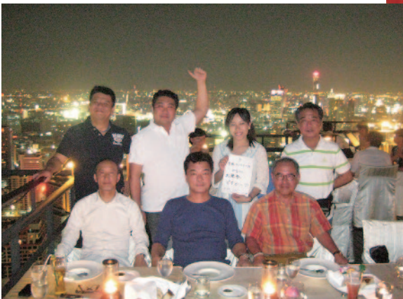
モーさんとの再会を祝して@バンヤンツリーホテルの天空 レストランにて まず日本では考えられないガラスなしの最上階です。