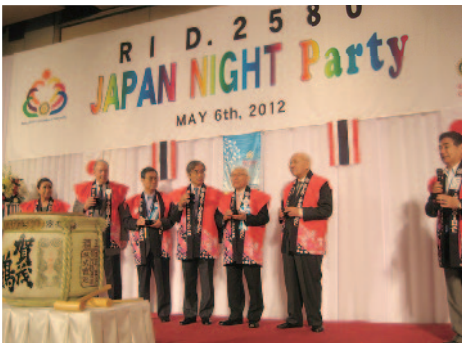
ジャパンナイトパーティーでの主賓の方々 真ん中マイクを持つのが在タイ日本国大使小島氏、 その右が田中会長エレクト