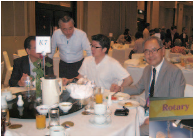
日本人朝食会 @Imperial Queen's Park Hotel