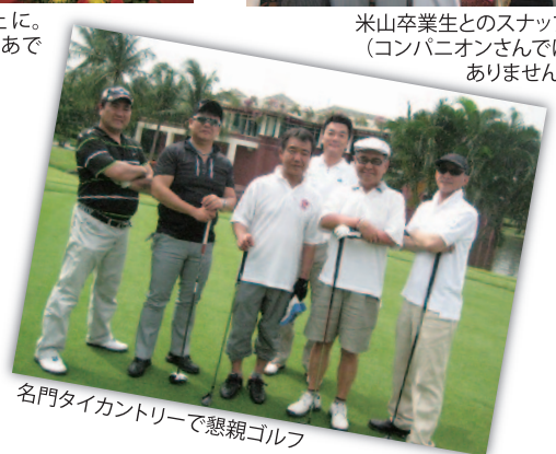
名門タイカントリーで懇親ゴルフ