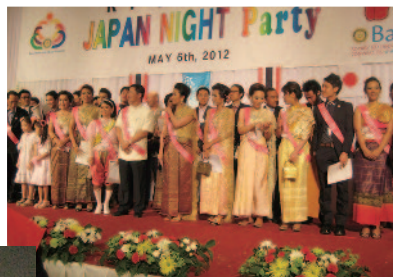
米山卒業生が壇上に。 それにしても皆さんあで やかです。