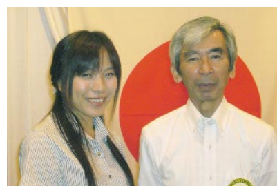
モーさん(米山奨学生)