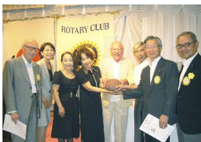
触らせて頂きました。かなりの重さ