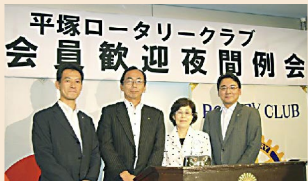
10 - 11年度新会員の皆様