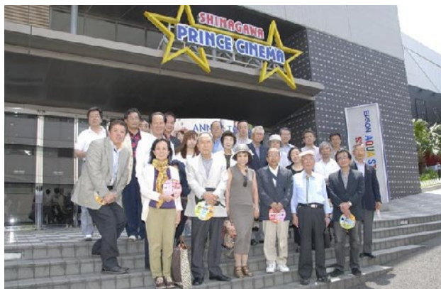
品川よしもとプリンスシアターにて

帯の幻想的な夜景を楽しむ「工場夜景クルーズ」を企画致しました。21日は日帰りバス旅行にふさわしい好天気の中で、震災以降忘れかけていた笑顔を吉本の笑いで取り戻し、震災で中止になった企業訪問にも似た夜間の