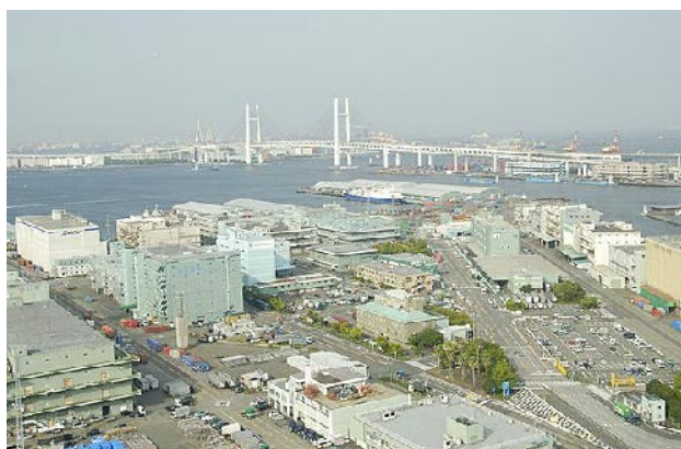
横浜に移動し、マリンタワー展望台からの眺め