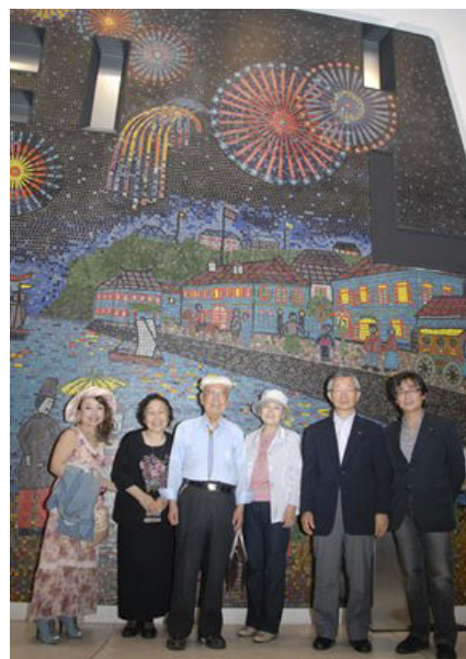
1Fフロアの「横浜の今昔」山下清 作