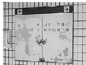
高久ビル前のぼり口 化粧直し<施工前>

高久ビル前のぼり口、つるや製菓前のぼり口、地下道中央壁面、交番のぼり口の4か所です。