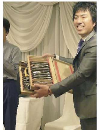
沢山のハーモニカ