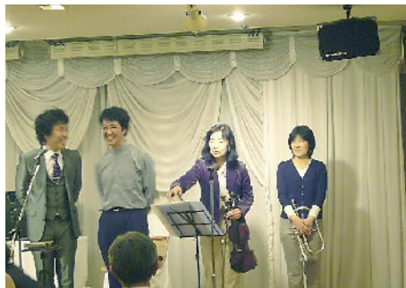
スペシャルユニットで演奏