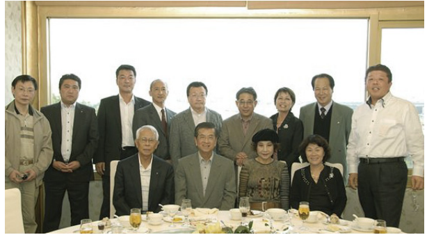
徐さんとの昼食会