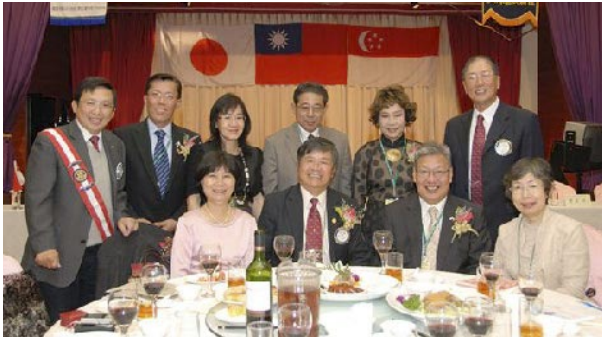
記念例会：(中央) 林社長、(右隣) 尼崎北 RC 会長、 (後列左 2) シンガポール RC 副会長